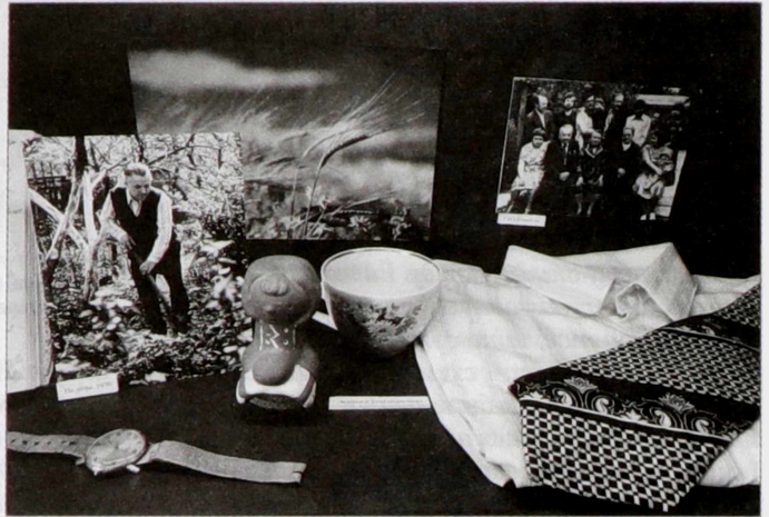
Асабістыя рэчы Івана Шамякіна ў экспазіцыі Літаратурнага музея пісьменнікаў Гомельшчыны.

Рэалізацыя праекта стала магчымай дзякуючы цеснаму супрацоўніцтву бібліятэкі з роднымі і блізкімі пісьменнікаў. У выніку карпатлівай, штодзённай працы нам пашчасціла атрымаць многія музейныя экспанаты, якія існуюць толькі ў адным экзэмпляры. Дастаткова назваць такія цікавыя рарытэты, як залікоўка студэнта БДУ Івана Мележа, датаваная 1943–1944 гг., з выключна выдатнымі адзнакамі; лісты дачкі Людмілы бацьку ў Ялту. Як вядома, пісьменніку часта даводзілася вязджаць на лячэнне да мора, і дзеці сумавалі. Вельмі шчымліва чытаць: “Милый папа, мои отметки 4 и 5. Скорее приезжай. Целую. Людмила. 1951 год”. Альбо ліст бацькі Паўла Фёдаравіча сыну са словамі ўдзячнасці за матэрыяльную дапамогу. Асаблівае месца адведзена ў нашай экспазіцыі друкарцы, якая, па словах дачкі Ларысы, вандравала з пісьменнікам паўсюдна. Яшчэ адзін унікальны экспанат, што захавалі для гісторыі і для нас подпісы ўсіх членаў Саюза пісьменнікаў таго часу, – прывітальны адрас