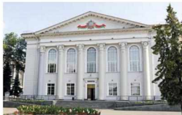
Здание Гомельской областной библиотеки, 2000-е гг.