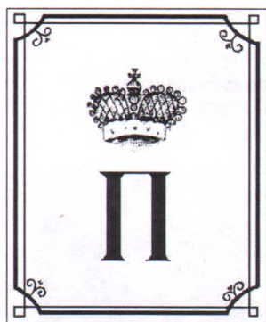
Рис. 5. Прямоугольный экслибрис библиотеки князей Паскевичей с изображением монограммы в виде буквы «П» под княжеской короной