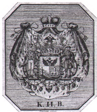
Рис. 4. Восьмиугольный гербовый экслибрис парадной библиотеки И. Ф. Паскевича