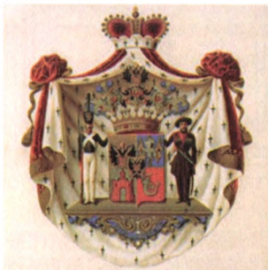
Рис. 3. Герб светлейшего князя Варшавского, графа Паскевича-Эриванского