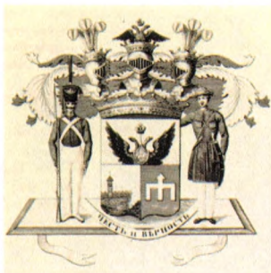
Рис. 1. Герб графа Паскевича-Эриванского