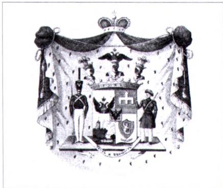
Герб князя Варшавского графа Паскевича-Эриванского

Теперь щит был разделён на четыре части: «в нижней левой части, в золотом поле в щите красного цвета изображена сирена, имеющая правую руку, вверх подъятую с мечом, а в