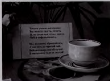
Конкурс читальных залов (Гомельская городская БС)

тию фондов и привлечению читателей в читальные залы. Так, в филиале №6 организовали бесплатные компьютерные курсы для пенсионеров «КОМПашка», в филиале №10 — уголок любителей чтения журналов, в филиале №14 — детский уголок, в филиале №15 — экспресс-паровозик «Читайка» с тематическими вагонами (например, «Самоделкин»,