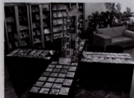
Конкурс читальных залов в Гомельской городской БС

Конкурсы профессионального мастерства в библиотечных системах области также способствуют продвижению книги и чтения. В качестве примера можно привести районные смотры-конкурсы «Библиотека. Книга. Читатель» и «Объединит поколения книга» среди библиотек Добрушского и Жлобинского районов, «Чытаем на роднай мове» —