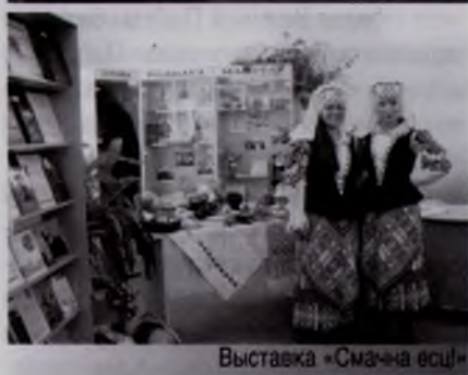
Выставка «Смак на еси»

ли такую профессию, отвечали на вопросы профессиональной викторины, участвовали в литературном аукционе, конкурсе на эрудицию «Библио-профи». Рогачевские участницы конкурса «Моя профессия — мое призвание» не только выполнили профессиональные задания и задания на общую эрудицию, но и выступили с театрализованным литературным монологом. Участники конкурса «Библиотекарь года» в Речицкой ЦБС готовят самопрезентации, проводят хоб-