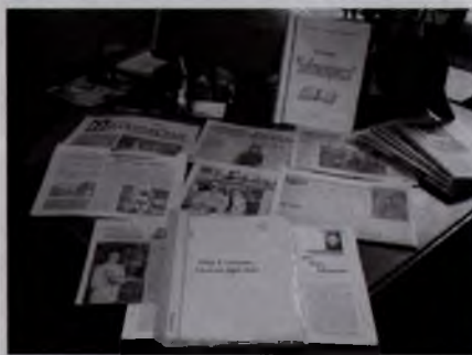
Библиопресса (Речицкая БС)