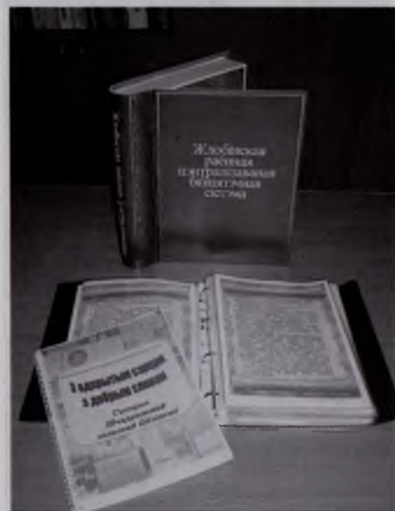
Конкурсная работа Щедринской сельской библиотеки (3-е место)

приятно, что материалы библиотек Гомельщины ежегодно получают высокую оценку жюри республиканского конкурса «Бібліятэка — асяродак нацыянальнай культуры» (за последние пять лет призёрами стали 12 из 18 работ).