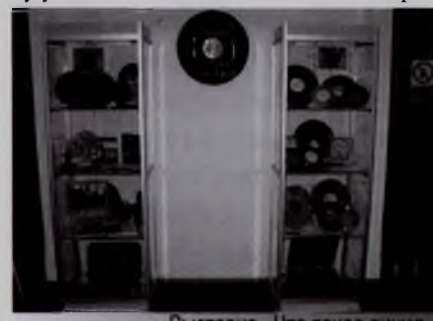
Выставка «Что такое винил»

Для библиотекарей участие в конкурсах — это возможность продемонстрировать свои профессиональные достижения, предъявить результаты работы с читателями и местным сообществом. Это также позволяет конкурсанту увидеть свою деятельность со сторо-