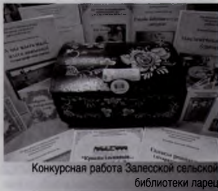
Конкурсная работа Залесской сельской библиотеки ларец