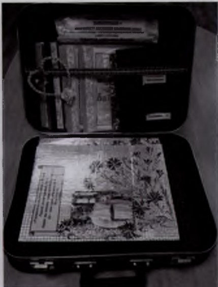
Конкурсная работа Коммунарковской сельской библиотеки. Чемодан откры-

В результате конкурса «Читальным залам — новое содержание» у библиотечкарей Гомельской городской системы появились интересные идеи по раскры-