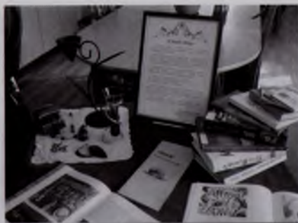
«Синий мир» (фрагмент выставки)

Популярны у нас и конкурсы, посвящённые активизации работы по тематическим направлениям работы. Библиотекари светлогорских городских библиотек принимали участие в конкурсе на лучший медиаурок «Здоровый образ жизни — это современно!», который был организован вместе с зональным Центром эпидемиологии и гигиены. В своих работах конкурсанты рассказывали об опасности для здоровья электронных игр, мобильных телефонов, курения, пива, о путях распространения ВИЧ-инфекции, говорили о необходимости соблюдать правила гигиены, заниматься спортом. Лучшие медиауроки