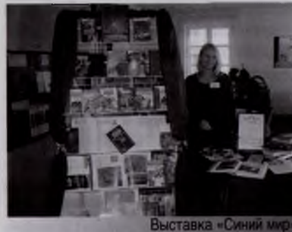
Выставка «Синий мир»

Среди библиотекарей светлогорских сельских библиотек был объявлен конкурс на лучшую историю библиотеки «Історыя бібліятэк Светлагоршчыны — культурная спадчына малой радзімы».