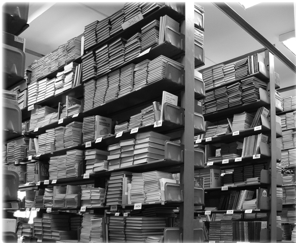
Хранилище библиотеки педуниверситета

Показали нам и служебное помещение, похожее на домашнюю кухню, где сотрудники готовят еду и обедают. После университета мы направились по узким вильнюсским улочкам к кафедральному католическому собору на площади Гедеминаса, где нас ждала экскурсовод. Она познакомила нас с собором, частным музеем янтаря, Свято-Даниловым монастырём и т.д. Проходили мы мимо