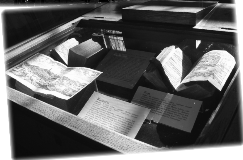
Выставка в зале Смуглевича