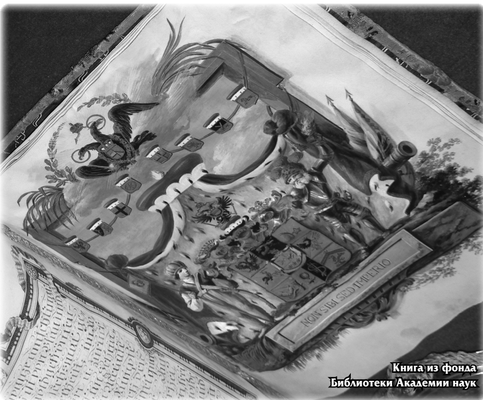
Книга из фонда Библиотеки Академии наук

И дея поездки членов Гомельского городского отделения Белорусской библиотечной ассоциации (ББА) в Литву родилась более года назад.